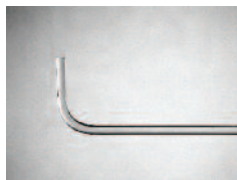
尖端弯曲的光导管