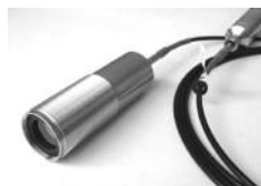
光纤连接在探测器和可选光学镜头之间 (镜头或光导管)