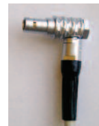
连接DEM的直角电缆 (标准电缆是直插接头)