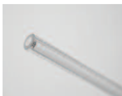
保护光导管的蓝宝石或石英护套