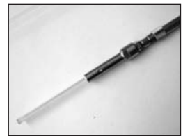
带吹扫功能的真空套管