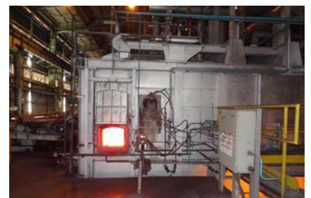
FurnaceSpection system setup