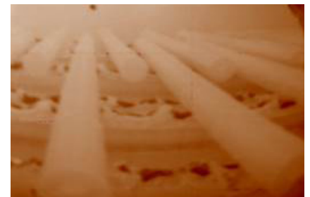
Infrared image of inside furnace